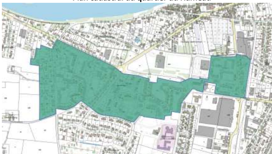
Plan cadastral du quartier du Hameau

Entré dans le programme de la Politique de la Ville en 2015, le Quartier Prioritaire de la Ville (QPV), le Hameau à Sully-sur-Loire, constitué de 4 secteurs : le Hameau, la Villanderie, la Résidence des Prés et les Châtaigniers, regroupe une population de 1 391 habitants en 2023.